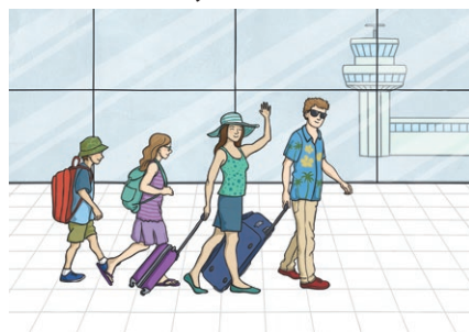
airport jī chǎng 机场