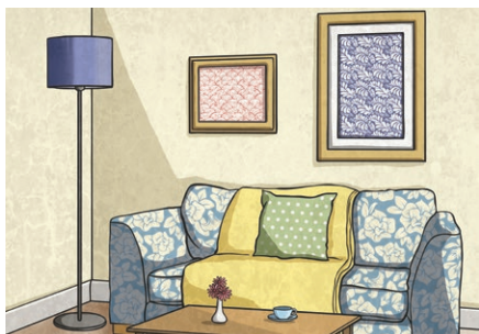
home jiā 家