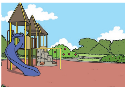
park gōng yuán 公园