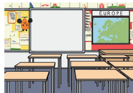
classroom jiào shì 教室