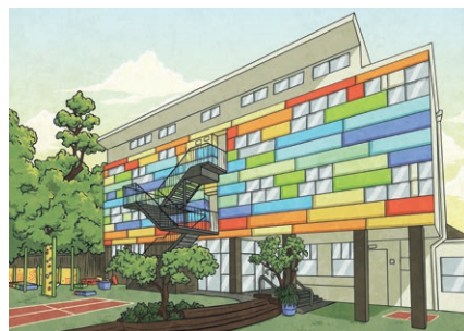
school xué xiào 学校