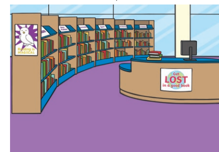
library tú shū guǎn 图书馆