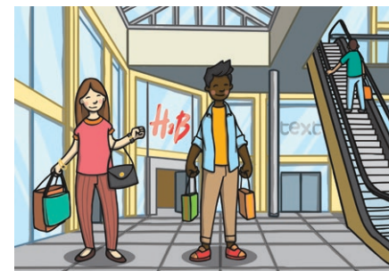
shop shāng diàn 商店