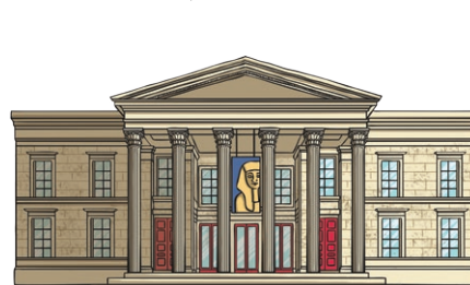
museum bó wù guǎn 博物馆