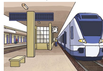
railway station huǒ chē zhàn 火车站